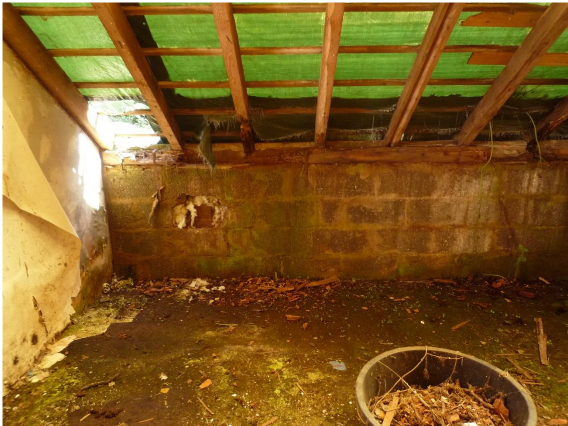
Foto 3 Dachgeschoss des Gebäudes mit Foliendach