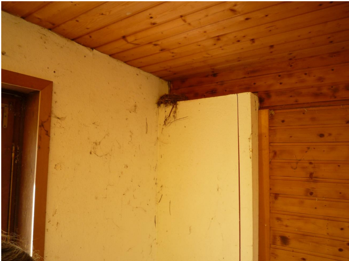
Foto 4 Nest im Gebäudeinneren, wahrscheinlich vom Hausrotschwanz