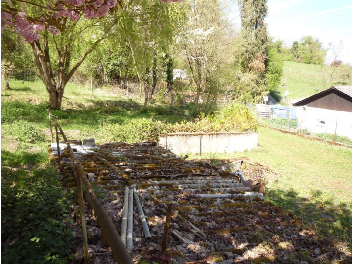
Foto 2 Geplantes Baugrundstück mit Schuppen, Mauer, Zufahrt und Gartenfläche