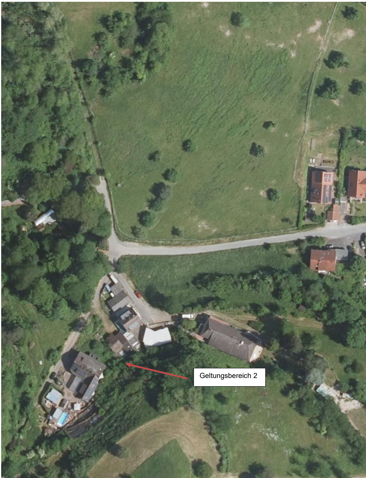
Abbildung 2 Luftbild mit dem Geltungsbereich 2 am Frankensteiner Weg