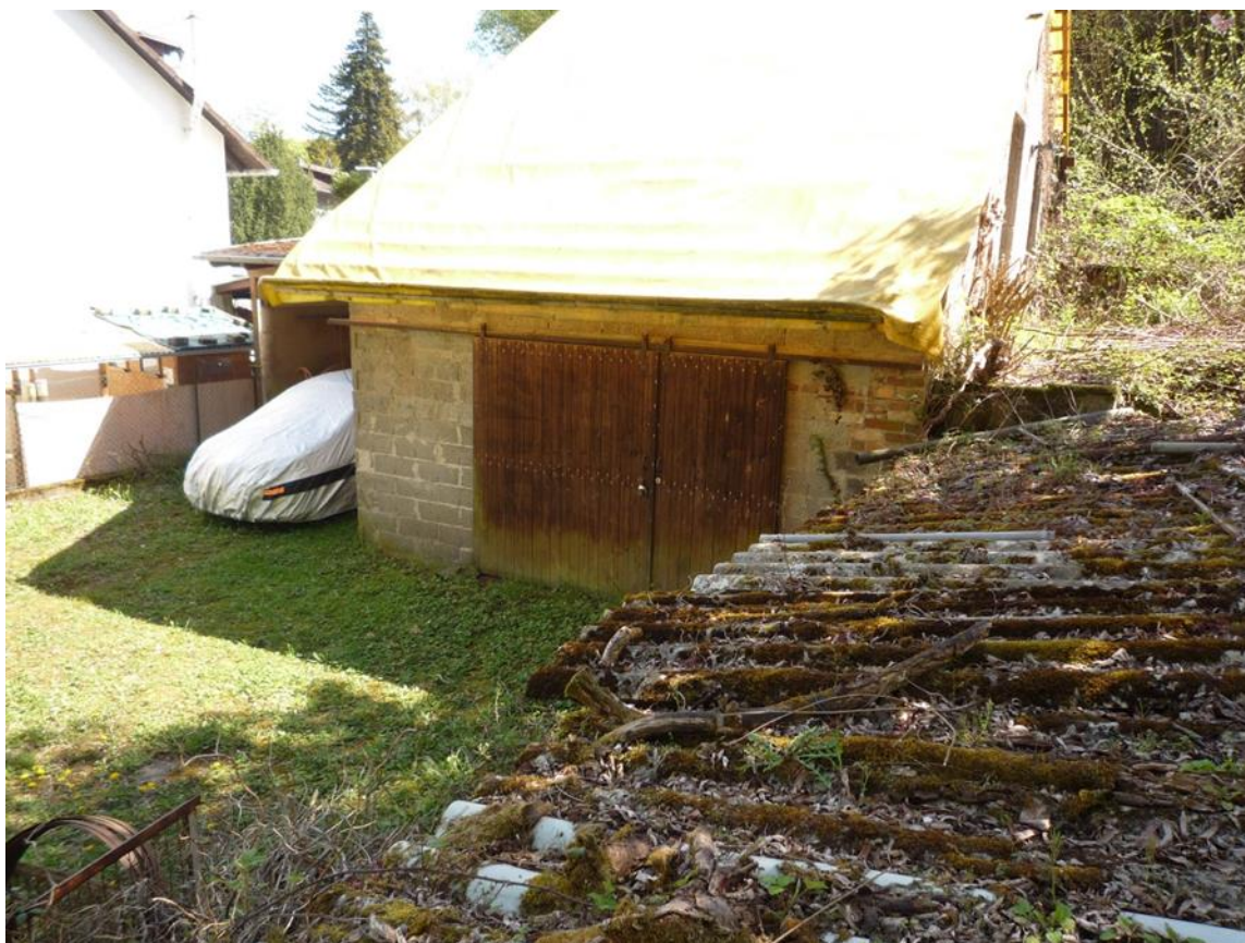
Foto 1 Geplantes Baugrundstück mit Schuppen und Carport

Von der Planung betroffen ist ein Grundstück zwischen Bebauung auf dem sich zwei Schuppen und ein Carport befinden. Auf dem Grundstück gibt es außerdem eine begrünte Zufahrt, eine ca. 1 m hohe Betonmauer sowie einen höhergelegenen überwiegend beschatteten ruderalen Garten mit Bäumen und Büschen, Brombeer- und Brennesselflur. Am Hang oberhalb der Gebäude befindet sich ein dichtes Gebüsch (s. Titelbild).